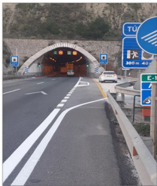
Apartadero COEX. Túnel de Lorca