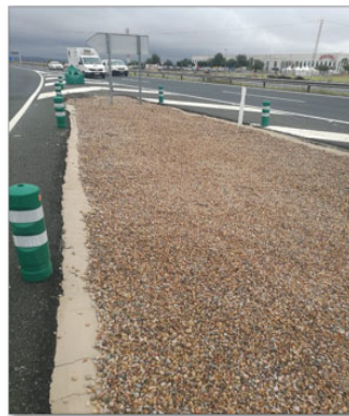
Fresado en narices y puntas