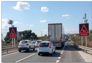
Señales luminosas P-31

Se activan cuando su radar detecta una situación de retención.