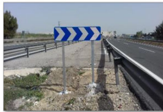
Paneles direccionales con iluminación LED

Se activan cuando su radar detecta una situación de retención.