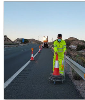
Balizamiento mediante conos con iluminación LED