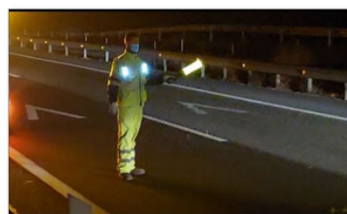
Chalecos con iluminación led