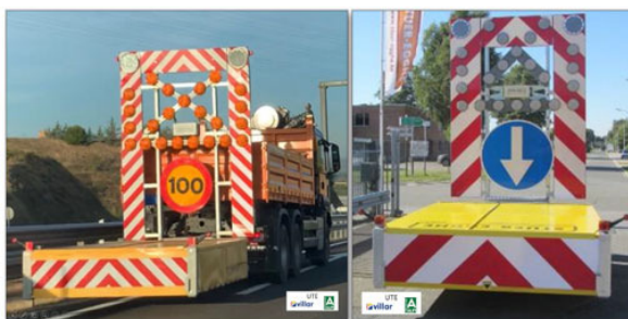
Camión con amortiguador de impacto para cortes de carril