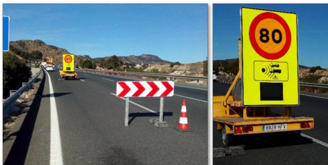
Radar informativo en cortes de carril