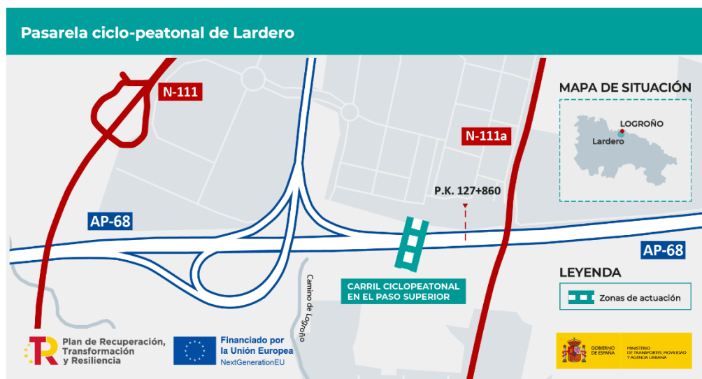
Croquis de ubicación

Del mismo modo, el proyecto está alineado con la Estrategia Estatal por la Bicicleta. Esta estrategia pretende fomentar el uso de la bicicleta en todos sus ámbitos: como medio de transporte cotidiano, como actividad turística o como herramienta para el deporte y el ocio, siempre con el objetivo de avanzar hacia la movilidad sostenible y activa. Para lograrlo, uno de los aspectos fundamentales es posibilitar la circulación en bicicleta de forma segura, mediante la construcción de infraestructuras como esta.