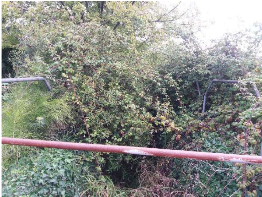
Previo a la actuación: Vegetación ocupando el tramo encauzado del arroyo de la Margen