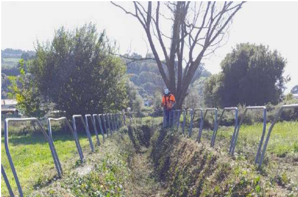
Durante la actuación: Trabajos de desbroce en el arroyo de la Margen