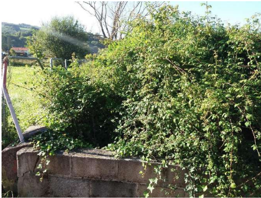
Previo a la actuación se observa acumulación de vegetación