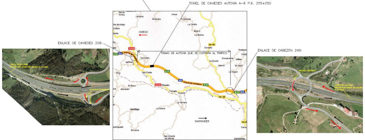
ENLACE DE CAVIEDES 258: