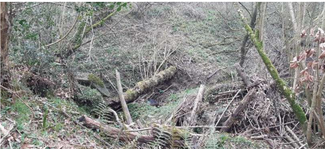
Antes. Taponamiento de restos de vegetales en el sumidero de la sima