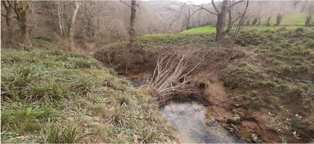
Antes: Restos vegetales con posibilidad de afectar posteriormente a la sima