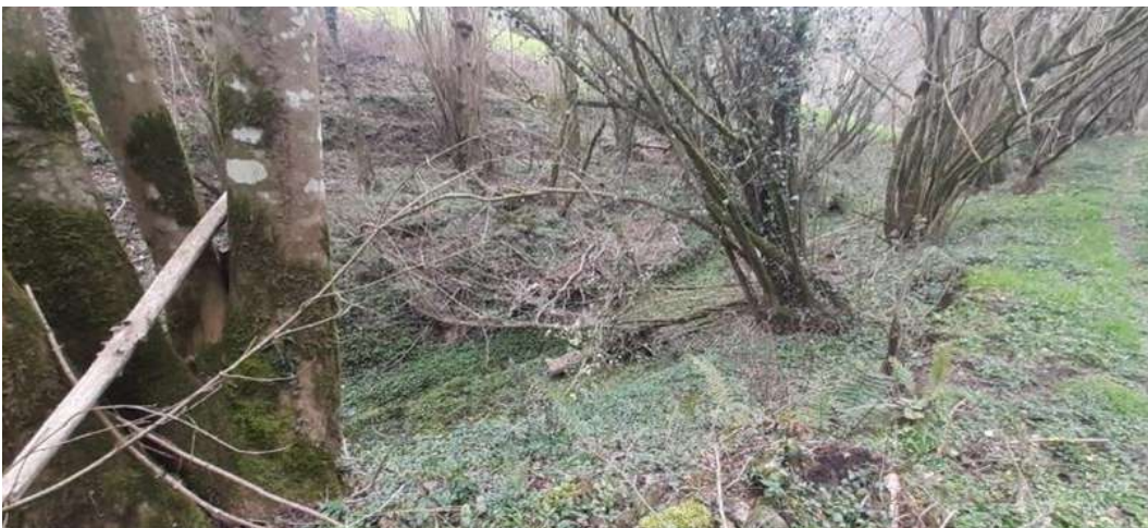
Antes: Restos vegetales con posibilidad de afectar posteriormente a la sima