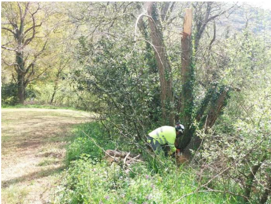
Trabajos sobre el arbolado con riesgo de caída al cauce