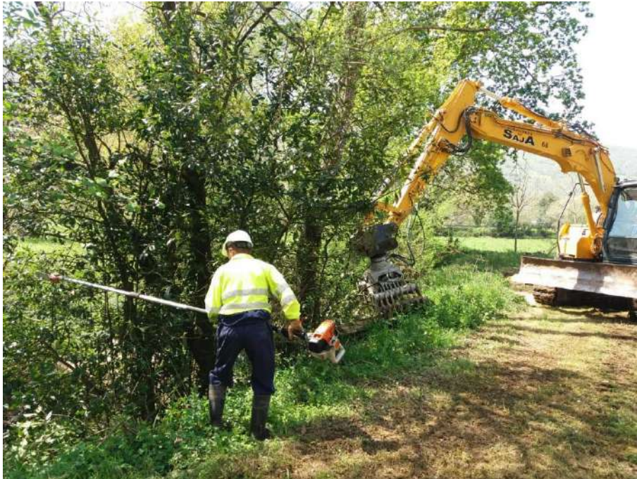
Trabajos sobre el arbolado con riesgo de caída al cauce