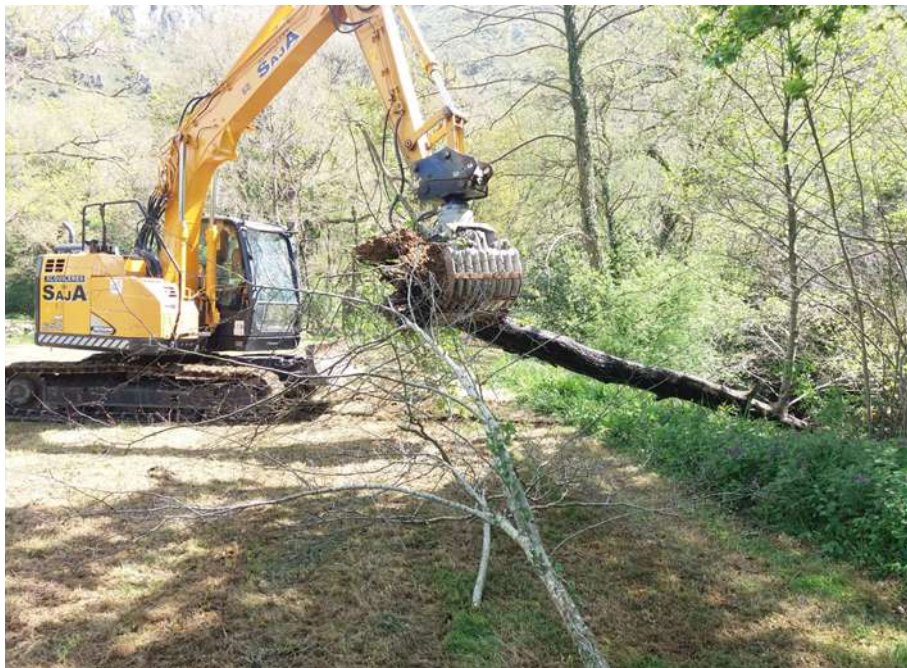
Extracción de restos vegetales del sumidero