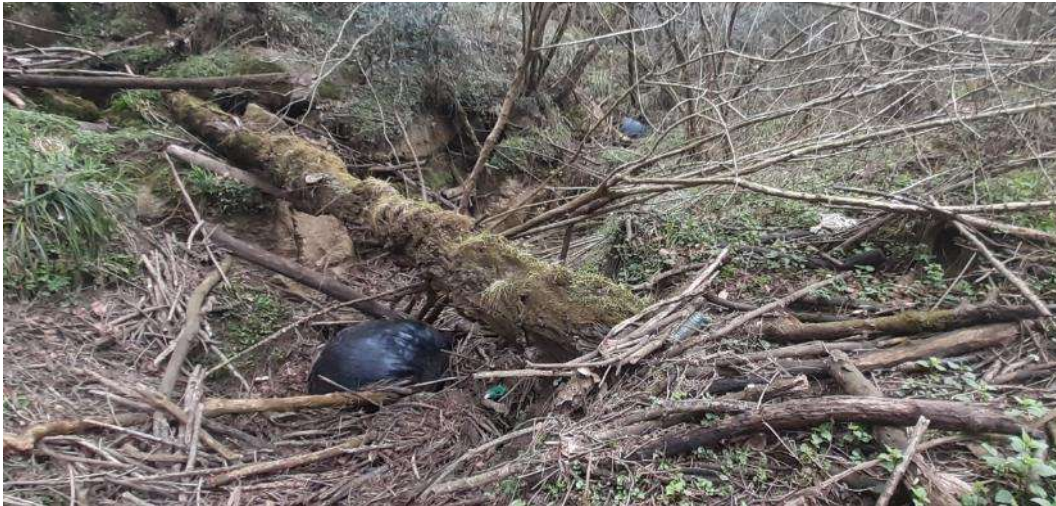
Antes. Taponamiento de restos de vegetales en el sumidero de la sima