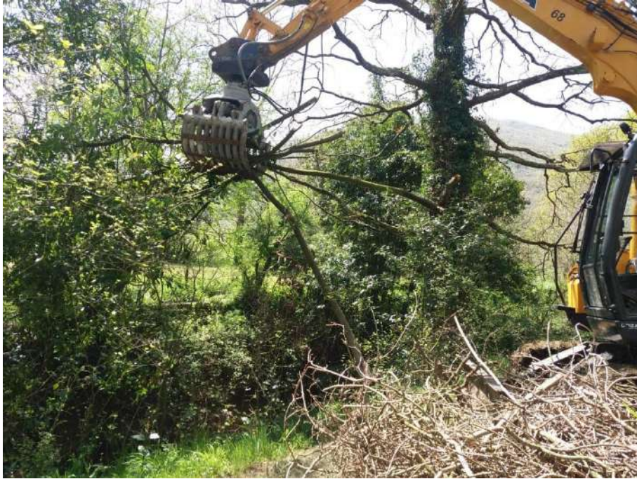
Extracción de restos vegetales del sumidero